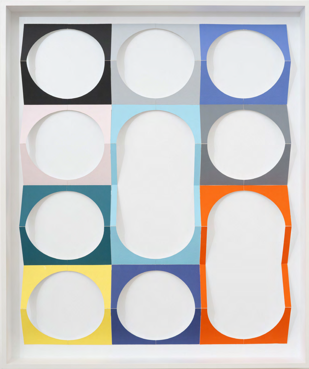
o. T. (Go), 2023, Lack, Karton, Holz 112,5 × 94,5 × 10 cm