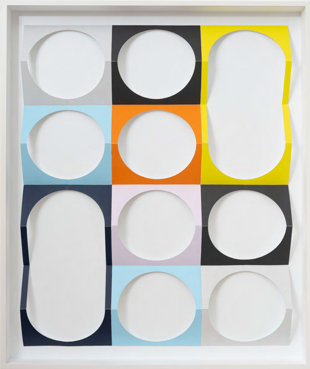
o. T. (Up), 2023, Lack, Karton, Holz 112,5 × 94,5 × 10 cm