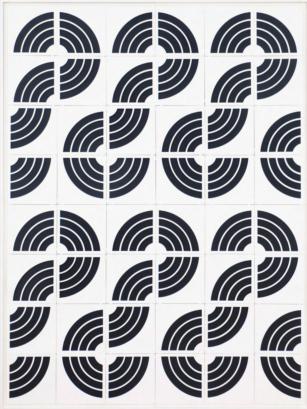
o. T. (Mental Flip 1) 2023, Lack, Papier, Karton, Holz 144 × 109 × 4 cm