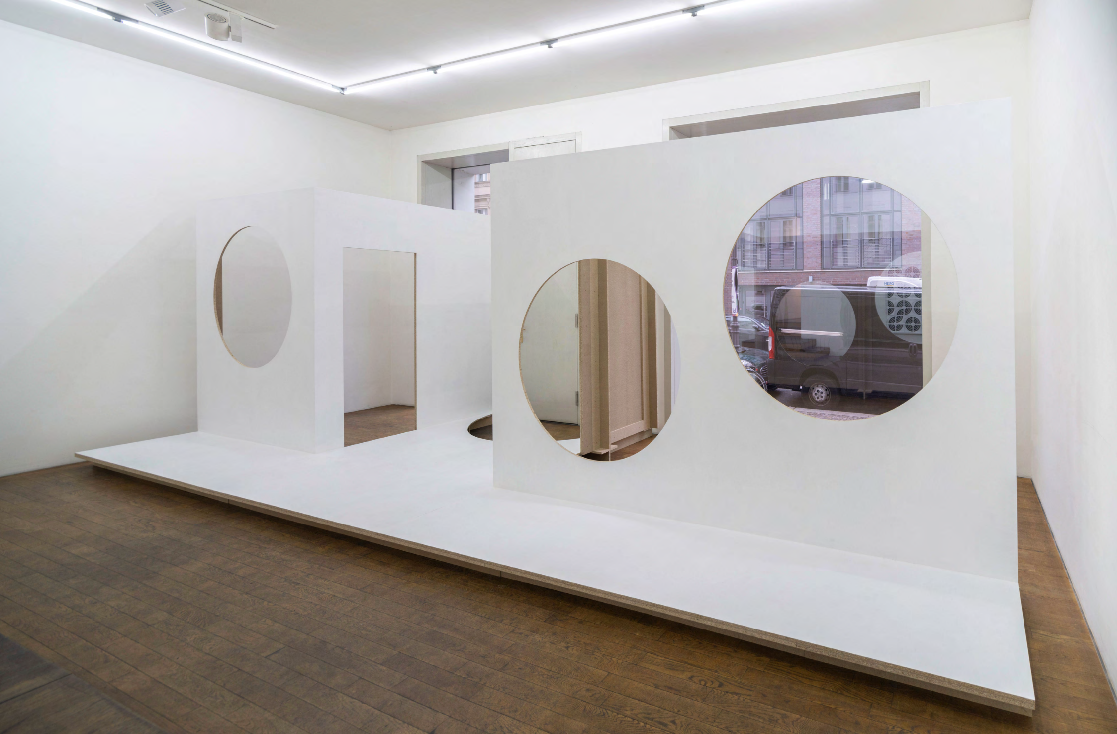
o.T. (oh hell o), 2023, Holz, Lack, Maß variabel