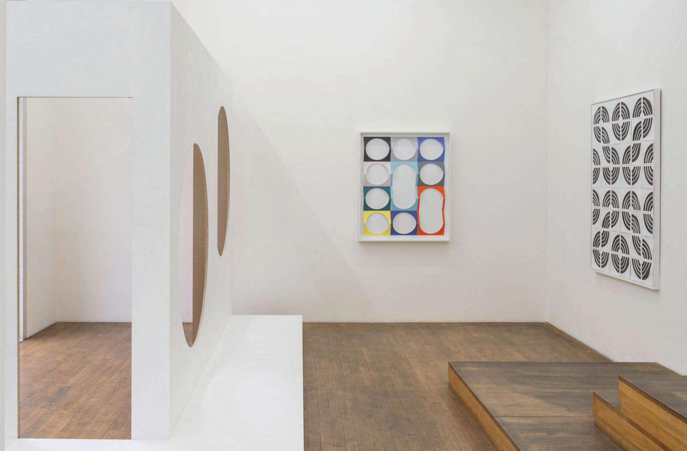
o. T. (oh hell o), 2023, Holz, Lack, Maß variabel