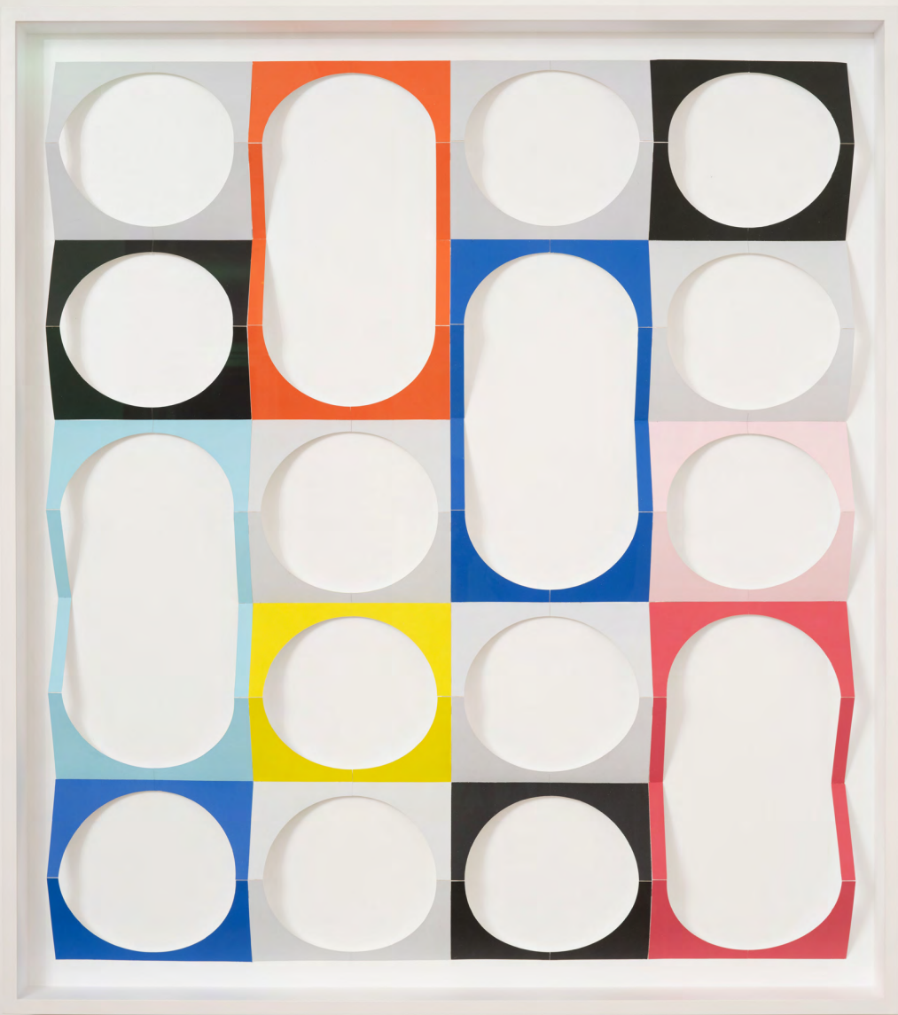
o. T. (Life), 2023, Lack, Karton, Holz 135,5 × 120,5 × 10 cm