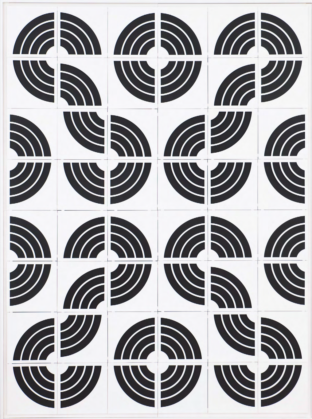
o. T. (Mental Flip 2) 2023, Lack, Papier, Karton, Holz 144 × 109 × 4 cm