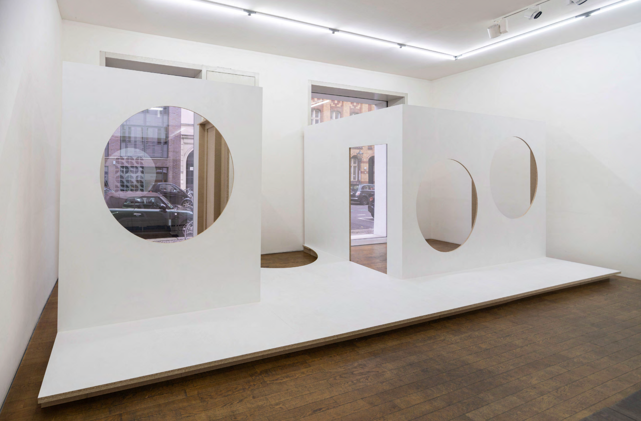
o.T. (oh hell o), 2023, Holz, Lack, Maß variabel